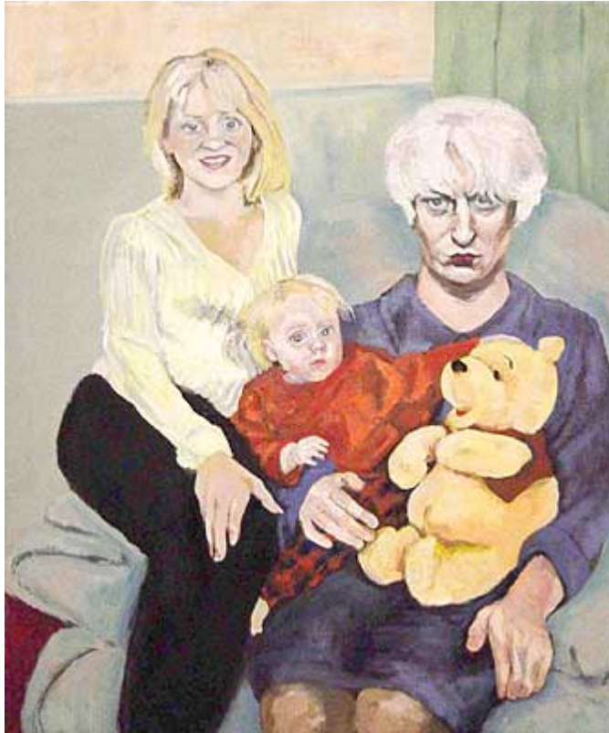
If we could undo psychosis II, 2003, óleo.