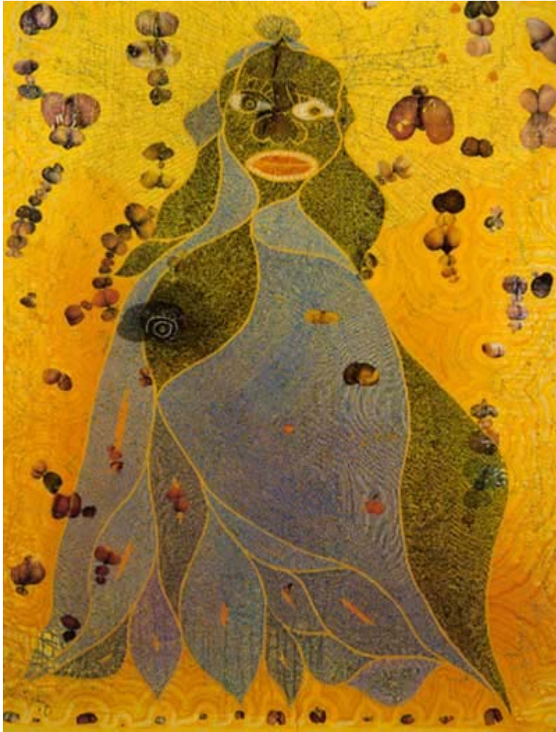
Holy Virgin Mary, óleo, 1995.