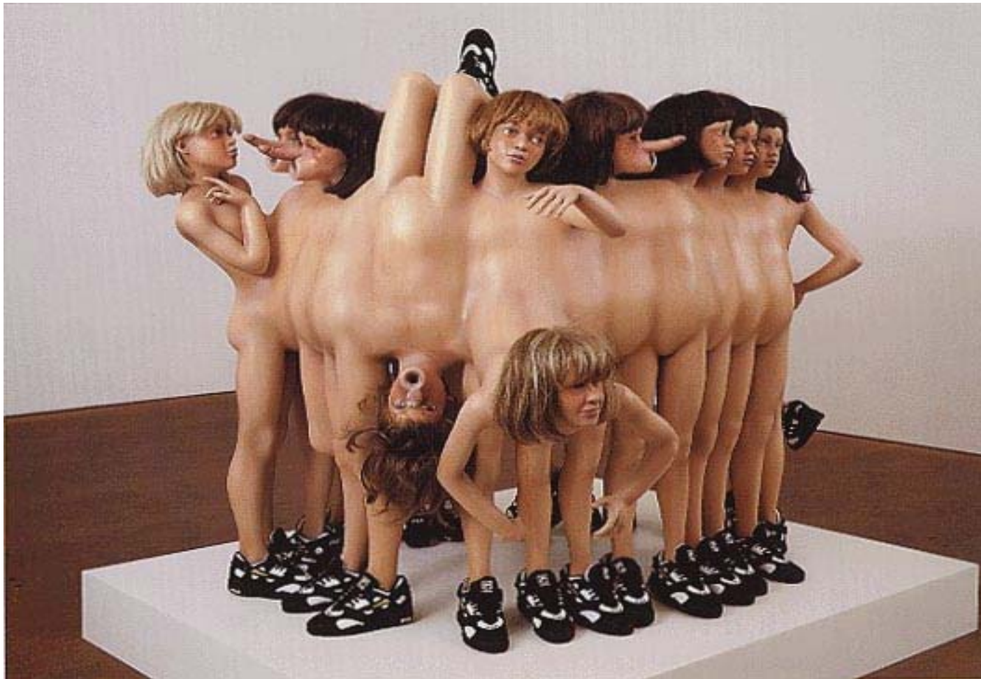
Zygotic acceleration, biogenetic, de-sublimated libidinal model, 1995, fibra de vidrio.