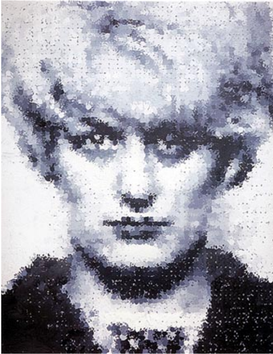
Myra, 1995. Pintura acrílica.